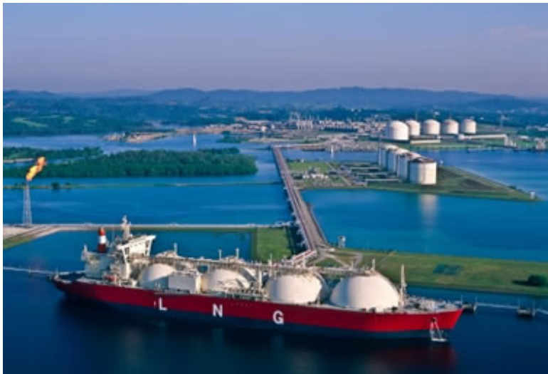
Рисунок 1 – Технологія LNG

застосовуються у світовій практиці, в ряді конкретних випадків не можуть бути використані в силу технологічних, фінансових, геополітичних чи інших обмежень.