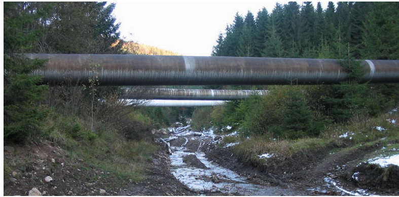
Рисунок 2 – Однопрогінні балкові надземні переходи МГ

МПа; D_{\text{вн}} – внутрішній діаметр труби, мм; \delta_n – товщина стінки труби, мм; n – коефіцієнт надійності за навантаженням.