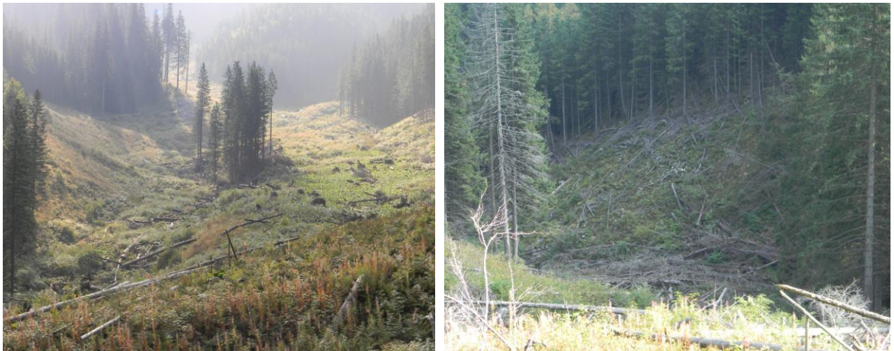
Рис. 1 – Фото пошкодженого сніговою лавиною лісу у природному заповіднику «Горгани»