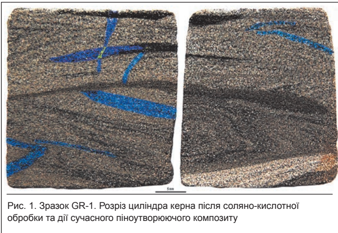
Рис. 1. Зразок GR-1. Розріз циліндра керна після соляно-кислотної обробки та дії сучасного піноутворюючого композиту

рит-дрібнопсамітовими теригенними скупченнями, зцементованими апоглинистим плівково-поровим цементом із частковим заповненням пор, рідко цемент базальний. У наступній серії може переважати алевролітова теригенна складова з глинистим цементом, що відрізняється нерівномірним розподілом.