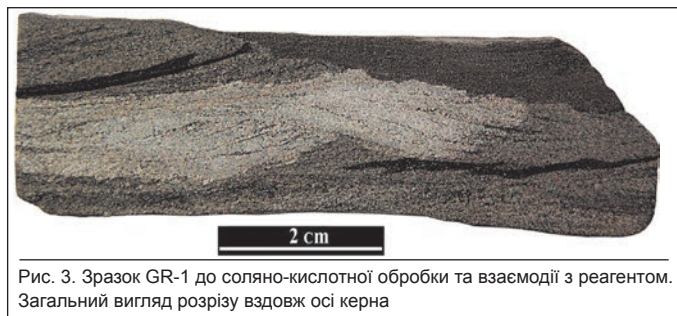
Рис. 3. Зразок GR-1 до соляно-кислотної обробки та взаємодії з реагентом. Загальний вигляд розрізу вздовж осі керна

Досліджувані породи завдяки широким кількісним варіаціям різних гранулометричних класів уламкового матеріалу (алевритового та дрібнопсамітового) та апоглинистого складу цементу з накладеною карбонізацією найбільш доцільно віднести до алевро-пісковиків із апоглинистим слюдисто-гідрослюдисто-карбонатним цементом.