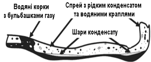
Рисунок 1 – Варіанти структури багатофазного потоку флюїду в трубопроводі свердловини

Ключовим елементом в контролі корозійних явищ, які зумовлені рухом, зокрема, багатофазного потоку вуглеводнів в трубопроводі свердловини, є розуміння характеристик потоку, які за визначених умов прискорюють розвиток вказаних вище специфічних корозійних процесів і їх зміну