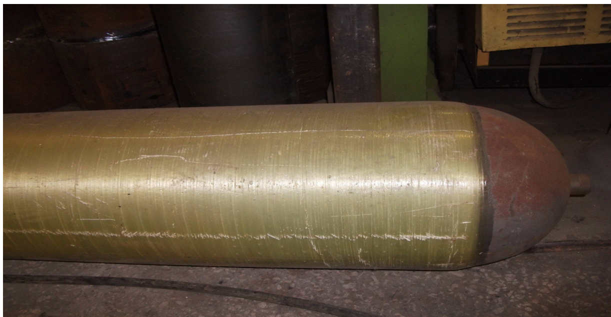
Рисунок 1 – Комбінований балон – сталевий лейнер з оболонкою із композиційного матеріалу

Мета роботи. Метою роботи є визначення на етапі проектування оптимального співвідношення товщин стінки металевого корпусу та композиційної оболонки, які забезпечать надійну експлуатацію балонів із заданими запасом міцності та довговічністю при циклічних навантаженнях.