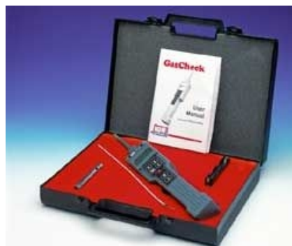
Рисунок 5 – Газовий детектор GasCheck

GMA 36 Pro є новою інтелектуальною системою з гнучким управлінням та настінним кріпленням. Система здатна фіксувати витoki різних токсичних газів, в тому числі і природ-