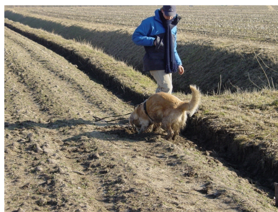
Рисунок 3 – Тренування собак

кисню, який визначає ділянки з низьким значенням його вмісту, дозволяє комплексно підвищити точність місцезнаходження витоків природного газу з газопроводу [7].