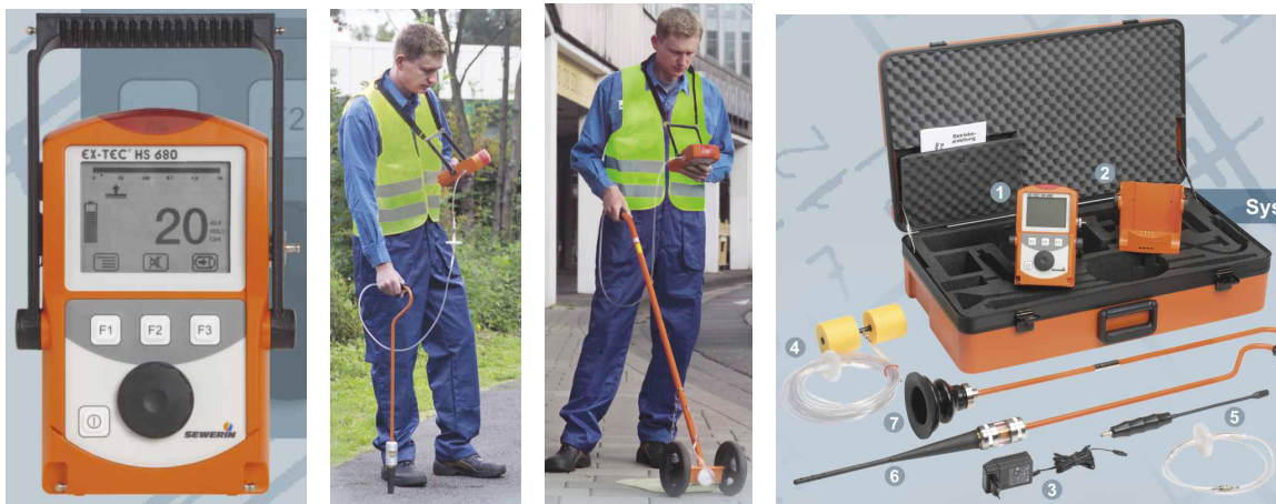
Рисунок 4 – Засоби контролю витоків газу серії EX-TEC

проводу пробивають (пробурюють) отвори – свердловини. Глибина свердловини визначається глибиною залягання газопроводу. Діаметр свердловини не має практичного значення і рівний 20–40 мм. Свердловина призначена для створення шляху виходу газу з ґрунту в атмосферу. При наявному витокі, газ часто виявляється в декількох свердловинах, а місце витoku газу визначають за свердловиною з найбільшою концентрацією газу на поверхні. Концентрація залежить від об'ємів витoku і відстані до місця витoku газу з газопроводу. Концентрація газу визначається за допомогою приладів – газоаналізаторів.