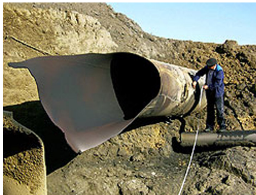
Рисунок 1 – Наслідки аварії на газопроводі, спричинені витокami газу

які перевищать границю плинності металу і спричинять його розрив.