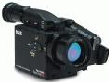
Рисунок 6 – Інфрачервона камера ThermaCAM GasFindIR

ThermaCAM GasFindIR – інфрачервона камера для швидкого виявлення витоків природного газу (рис. 6).