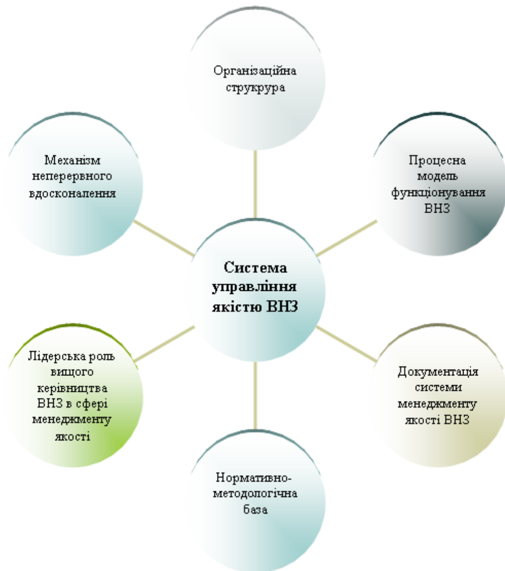
Рисунок 1 – Основні елементи системи управління якістю ВНЗ