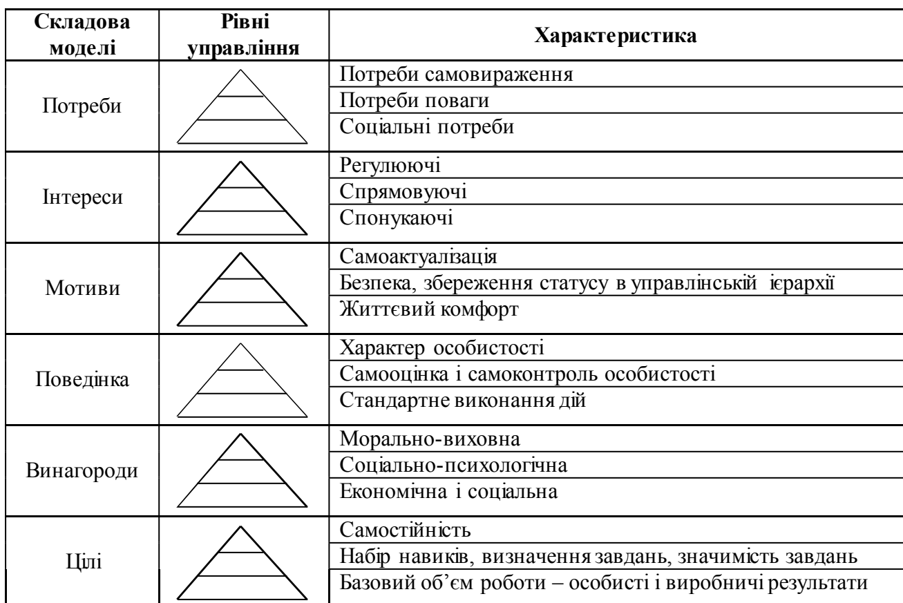
Таблиця 1 – Мотивація управлінської праці через потреби

Мотивація є внутрішнім механізмом, що спонукає до діяльності. Мотивація управлінської праці – це сукупність управлінських робіт, спрямованих на розробку та використання стимулів до ефективної взаємодії суб'єктів управлінської діяльності. В основі мотивації є комплекс динамічних потреб, які і визначають напрям використання потенціалу керівника [6, с.68]. При аналізі потреб необхідно враховувати рівні управління. Розглянемо модель мотивації управлінської праці через потреби на трьох рівнях управління: TOP, MIDDLE, LOWER (табл. 1) [розробка автора].