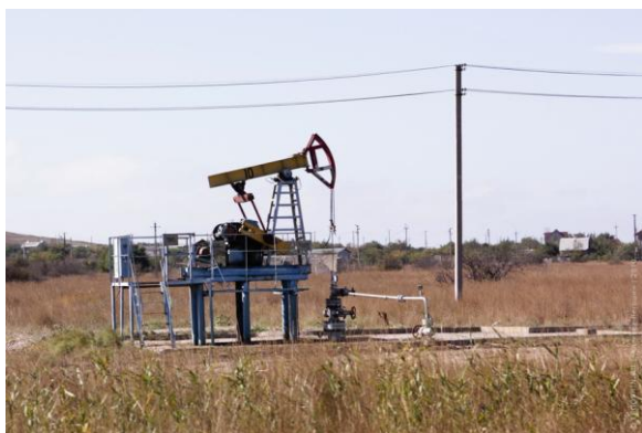
Рисунок 2 – Нефтяная скважина ООО «Азовская Нефтяная Компания»

Проблема усугубляется нежеланием по тем или иным причинам создавать прогрессивные методы и технические средства объективного контроля. Выяснение объективных причин сложившейся ситуации с системами контроля выходит за рамки данной статьи.