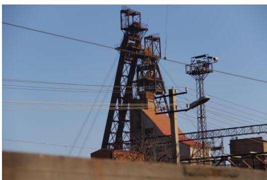
Рисунок 1 – Шахта «Октябрьская» (г. Кривой Рог)

Проблема усугубляется нежеланием по тем или иным причинам создавать прогрессивные методы и технические средства объективного контроля. Выяснение объективных причин сложившейся ситуации с системами контроля выходит за рамки данной статьи.