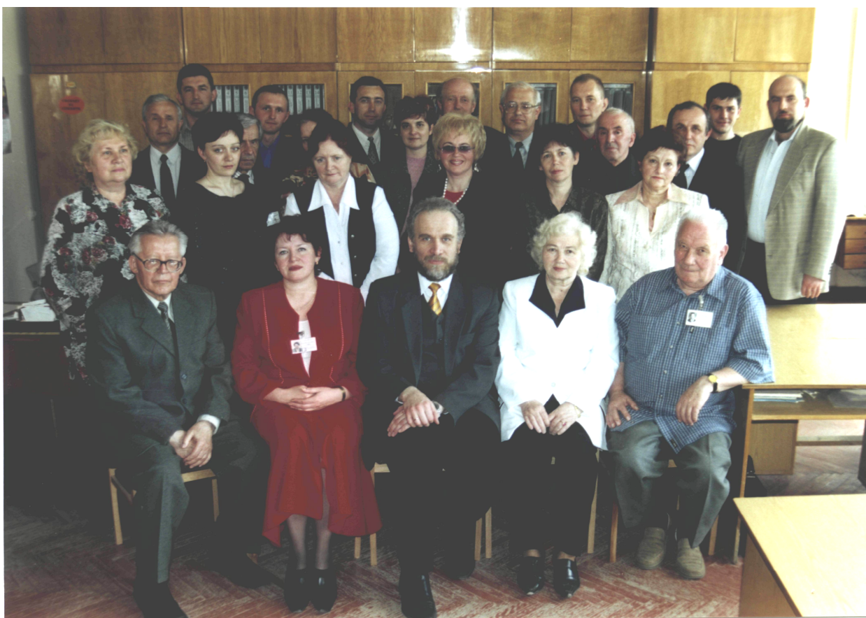
Кафедра вищої математики ІФНТУНГ. 2005 р.