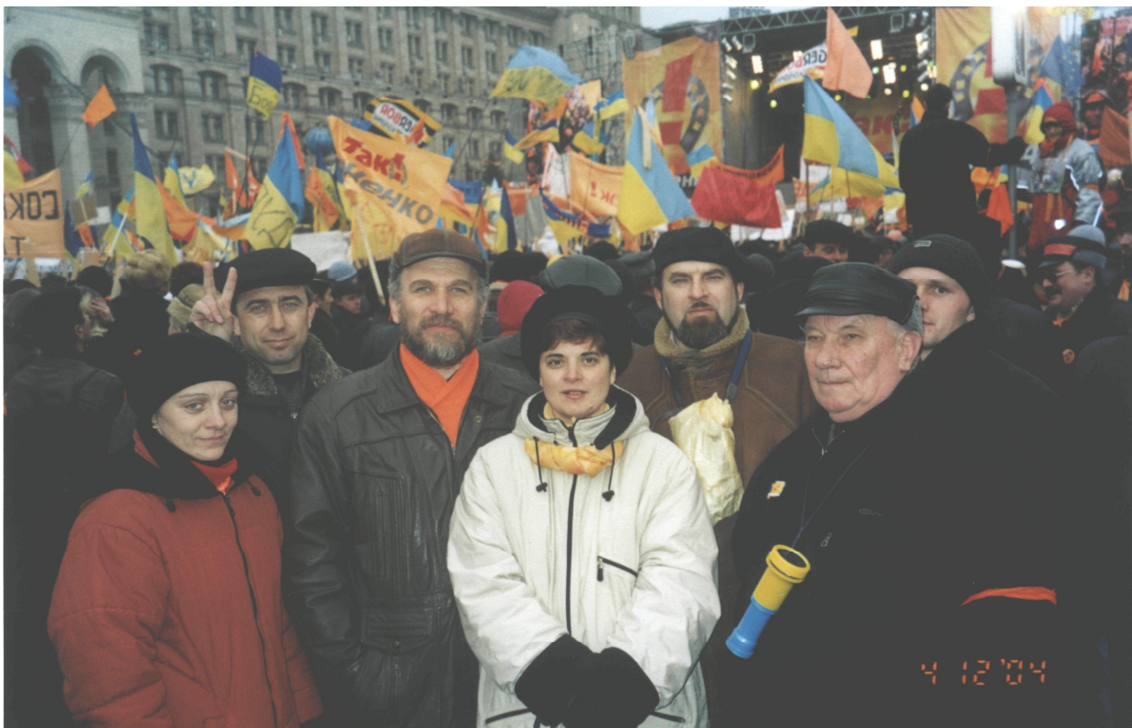
Викладачі кафедри на Майдані у Києві під час Помаранчевої революції. 2004 р.