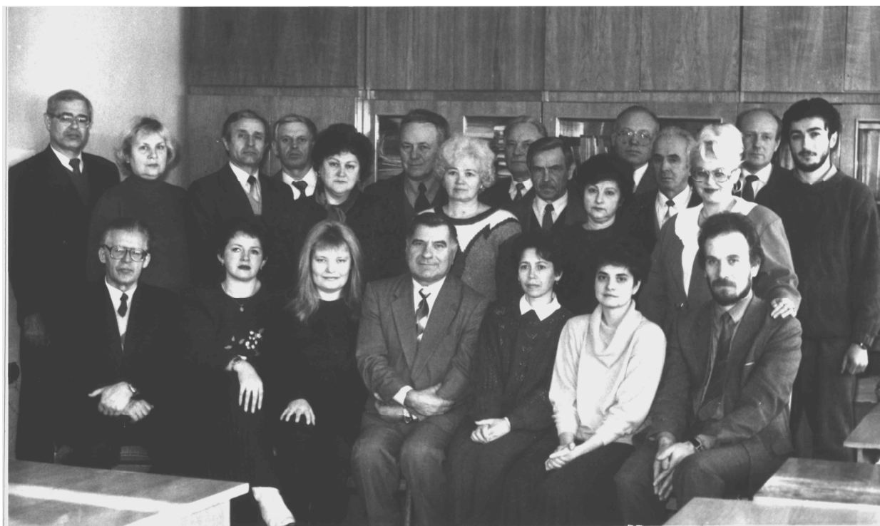
Колектив кафедри вищої математики ІФДТУНГ. 1996 р.