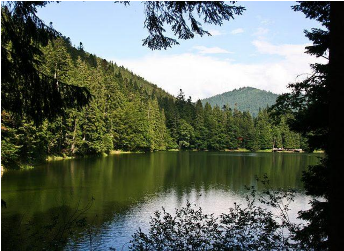
Національний природний парк «Синевир»