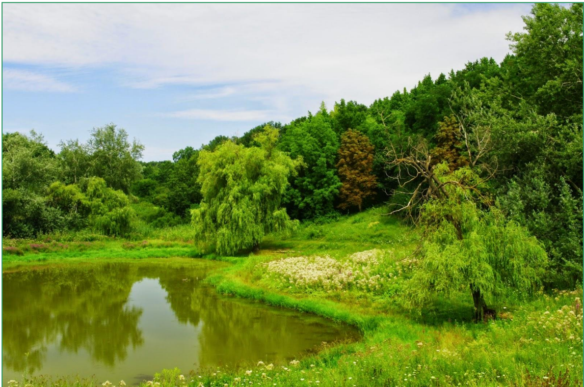
Заповідник «Сланецький степ»