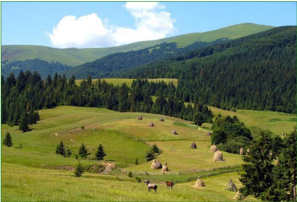
Національний природний парк «Гуцульщина»