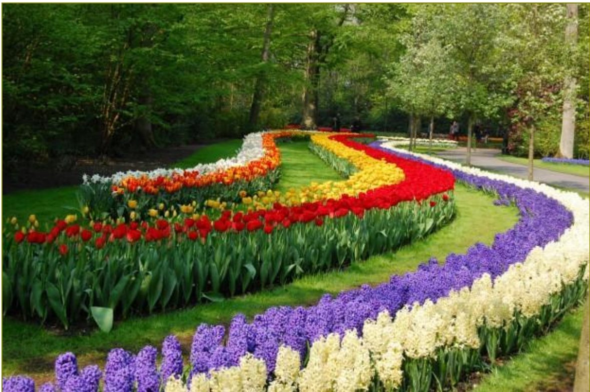
Нікітський ботанічний сад