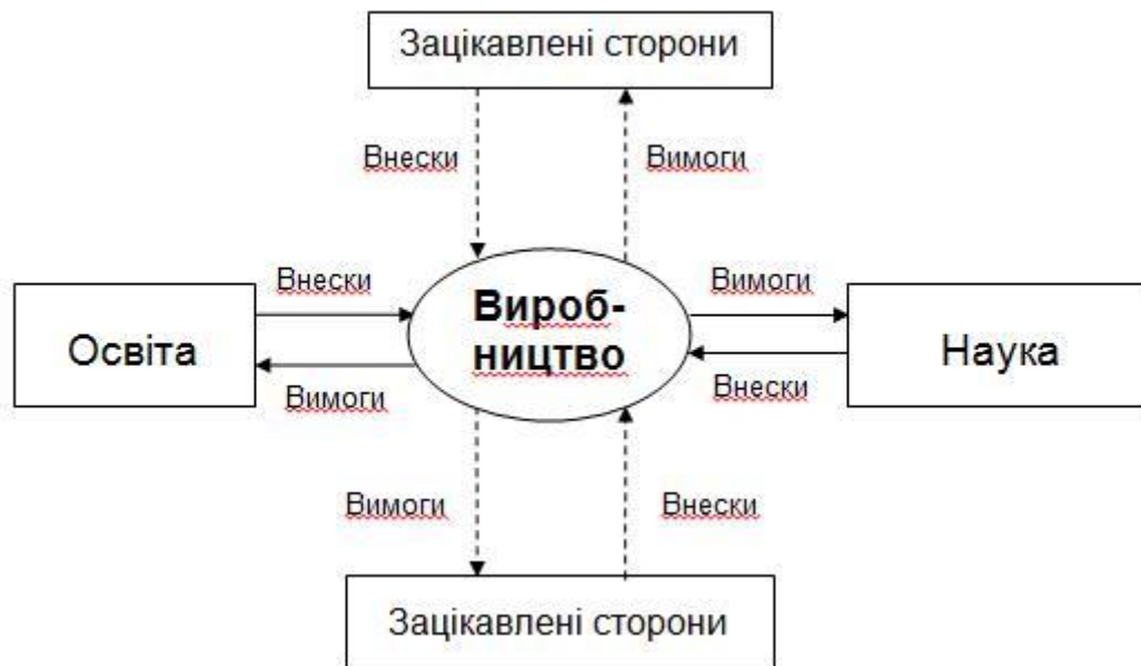
Рис. 2 - Адаптивна модель партнерських відносин АС у системі «виробництво – освіта – наука» нафтогазового комплексу

Висновки. Отже, оцінюючи загальну картину налагодження партнерських стосунків у «трикутнику знань» через концепцію зацікавлених сторін, та можливостей її застосування для потреб нафтогазового комплексу, можна зробити висновок, що ці процеси знаходяться на початковому етапі. Це пояснюється як суб'єктивними причинами, так і об'єктивними обставинами. Серед них – надто тривалий пошук правильного вибору основних напрямів співпраці між партнерами, які би максимізували цінність таких стосунків для кожної із сторін. Окрім цього, незначною є кількість успішних суб'єктів господарювання у всіх сферах економіки та нафтогазового комплексу зокрема, які здатні вийти за рамки стратегії виживання і приступити до розробки стратегії партнерських відносин, розроблення та реалізації локальних та регіональних програм розвитку. Потрібно створювати умови і правила для стимулювання та пошуку оптимальної моделі партнерства у нинішніх умовах, розробляти ефективний організаційно-економічний механізм її реалізації через концепцію зацікавлених сторін.